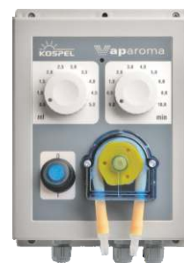
Дозатор аромата VAPAROMA DA.01-01.PL