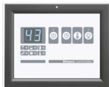
Панель управления для общественных мест W.PS-01.P