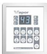
Панель управления PHEW3.VAPOR