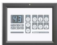
Панель управления W.PS-01