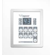
Панель управления с корпусом для установки PHEW3.RB VAPOR