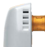
Сопло парогенератора GWD.2